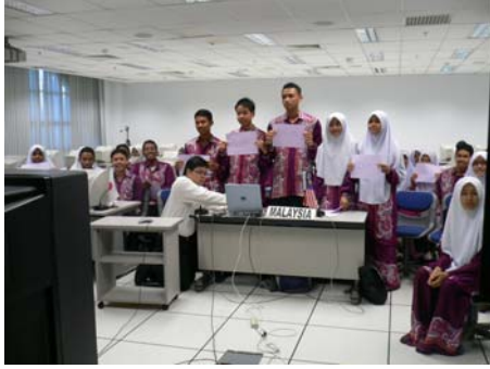
カタカナで書いた自分の名前を持って自己紹介