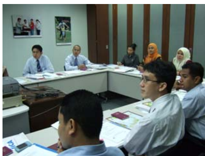
説明を熱心に聞く参加者たち

2007度から新たに生まれ変わった青年研修事業の第一陣がマレーシアから出発します。第一陣は「行政(人材開発・人材養成)」のコースで、7月2日から7月19日までの18日間、今回は栃木県を主な舞台に様々な研修を行う予定にしています。栃木県は、2006年度まで約22年間実施された「青年招へい事業」でも、マレーシアからの最初の参加者を受け入れてくれた県であり、今回新たに生まれ変わった同事業の最初のグループが同県を訪問するというのも、不思議な縁を感じます。今回の参加者は、サラワク州やペラ州など様々な地域から集まった16名の公務員の若手たちです。それぞれが、職場で人材開発分野にたずさわり、今回の日本での研修においても、なんでも学びとってこよという積極的な姿勢で大変好感が持てました。今年はマレーシア独立50周年記念の年でもあり、同時に日マ友好50周年の記念すべき年でもあります。この記念すべき年に生まれ変わった新たな研修事業で日本に赴く若者たち。彼らには8月に予定している、栃木青年団の訪マの際に実施予定の交流会にも参加してもらおう予定です。栃木県での研修で多くのことを学び、マレーシア社会の発展に役立ててくれることを願っています。