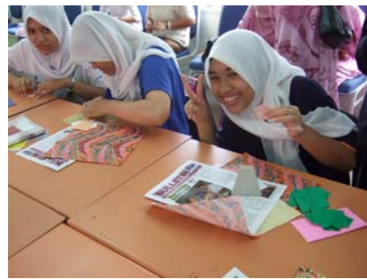
楽しく折り紙に挑戦する生徒たち