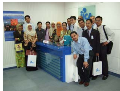
参加者全員で記念写真。「行ってきまーす！」