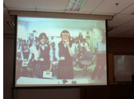
鬼のお面をかぶって節分の説明をする日本人学生